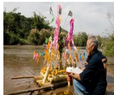
วันสงกรานต์ล่อง