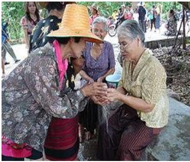
วันมหาสงกรานต์

ในวันสงกรานต์ของประเทศไทยในแต่ละภาคจะมีชื่อเรียกที่แตกต่างกันออกไป ดังนี้