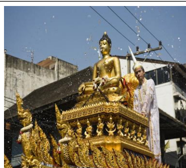
วันเจ้าเมืองเก่า